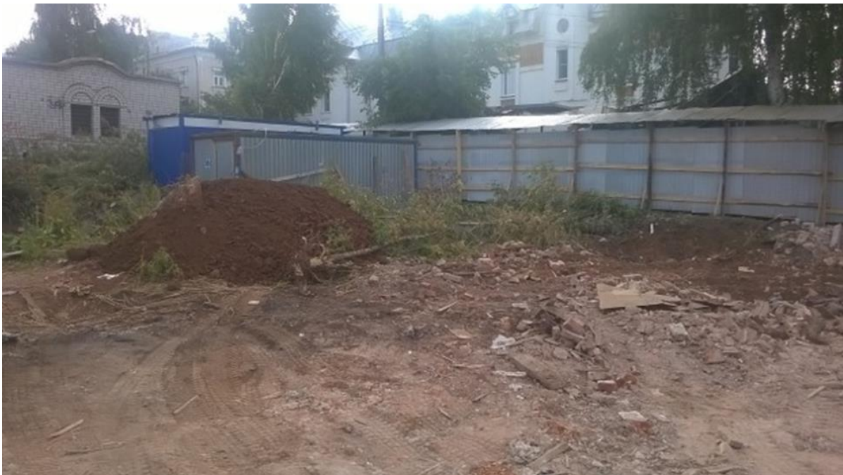
г.Киров, ул.Свободы,84а. Общий вид на исследуемый участок с дворовой территории