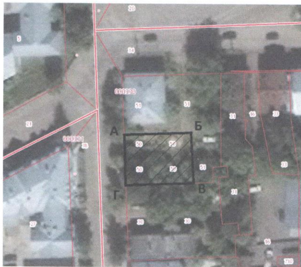
Схема границ территории участка по адресу: г. Киров, ул. Свободы, д. 84а.

Северная граница проходит по границе участка с кадастровым номером 43:40:000330:51, восточная граница проходит по границе участка с кадастровым номером 43:40:000330:31. Южная граница проходит по границе участка с кадастровым номером 43:40:000330:30. Западная граница проходит по границе участка с кадастровым номером 43:40:000330:51.