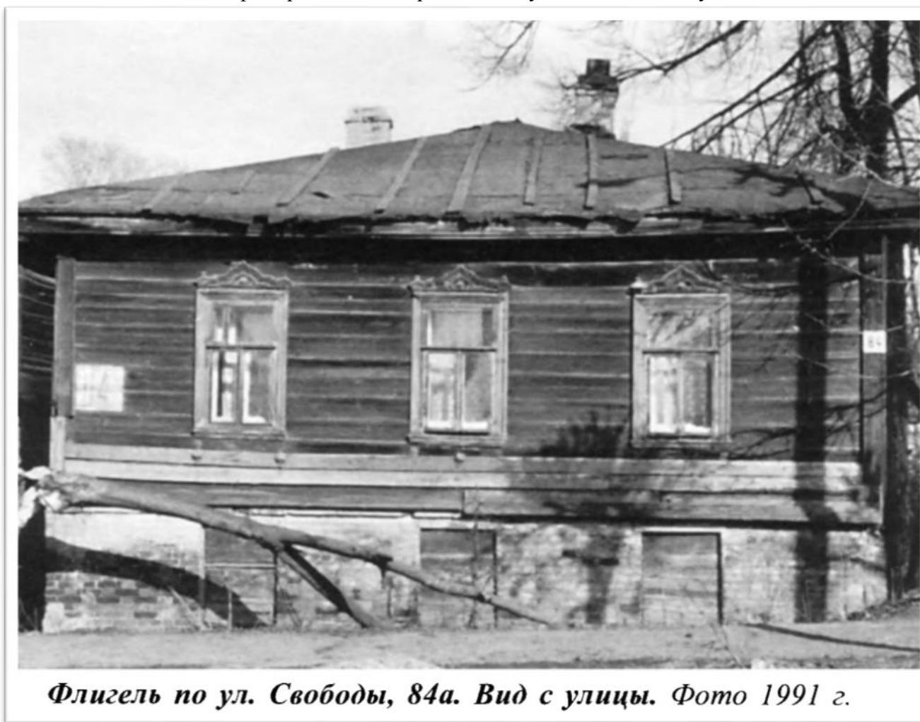
Рис.5.Архивная фотография одного из домов «Усадьбы Ильина» в г.Киров.

позволяют точно идентифицировать место рождения художника А.В.Исупова.