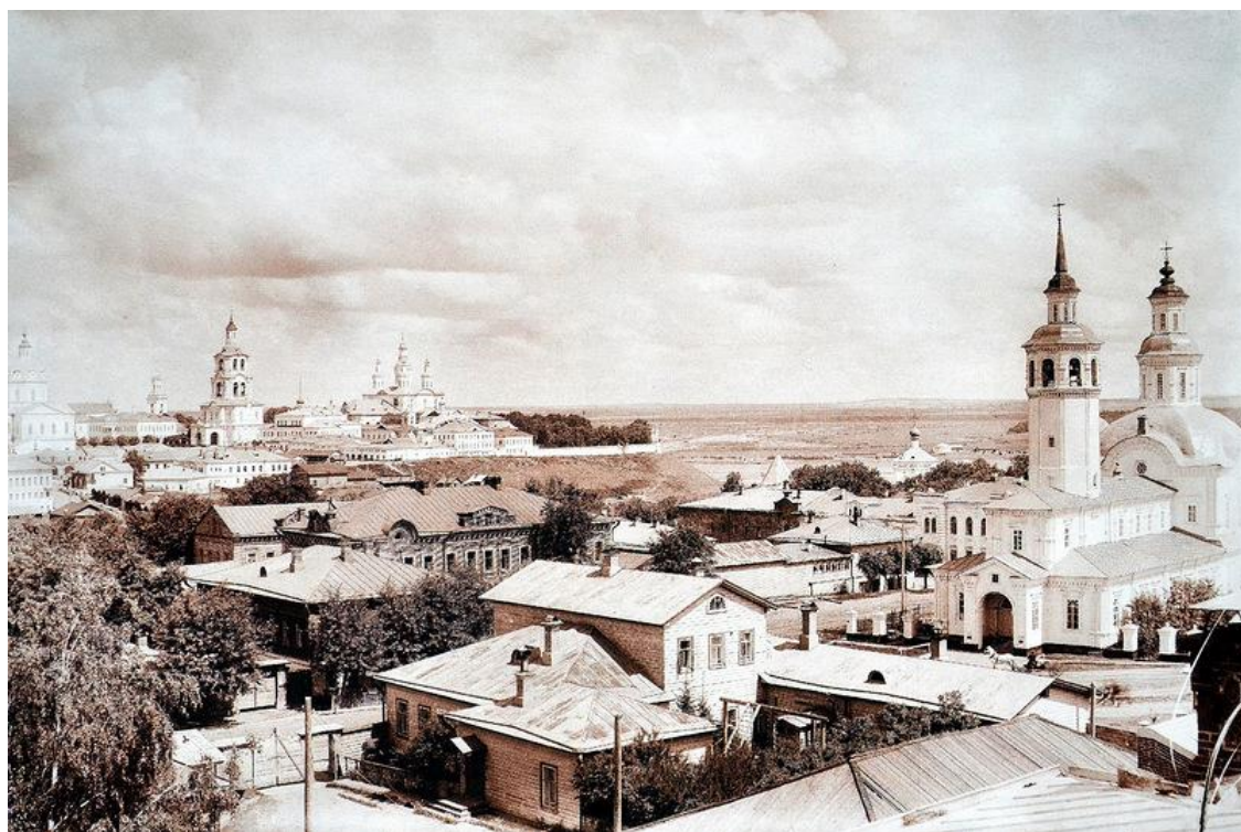
Рис.2. Вид города Вятки с юго-западной стороны. Справа - Стефановская церковь. Архивное фото 1911 г.

Эта часть города в конце XIX – начале XX вв. была застроена обывательскими домами: деревянными, деревянными на кирпичном цоколе и кирпичными в один и два этажа, под двускатными и вальмовыми крышами. Застройка была усадебного типа, дома главными фасадами выходили на красную линию улиц.