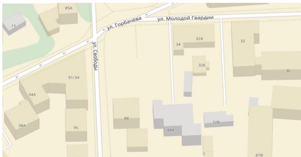
Рис.3. г.Киров. Квартал города, образованный улицами Горбачева, Молодой Гвардии и Свободы. На карте указан дом по адресу: Свободы,88.

Далее по улице – кирпичный двухэтажный флигель (улица Свободы, 86а) - прямоугольный в плане, сильно вытянут в сторону двора; с двухскатной крышей, возведённой на надстроенных стенах. Все шесть фасадных окон, выходящих на улицу (по три на этаж), были декорированы наличниками.