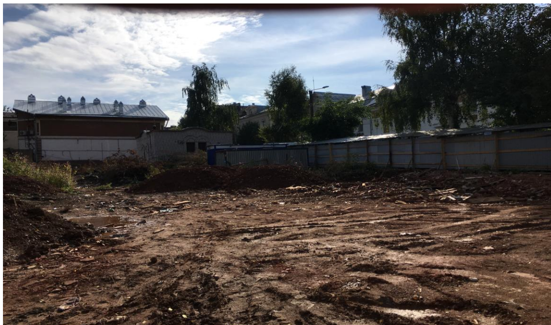
Рис.7. Фотофиксация участка по адресу: г.Киров, ул.Свободы,84а с дворовой территории. сентябрь, 2017 г.

Проведенный экспертом анализ документов свидетельствует о следующем.