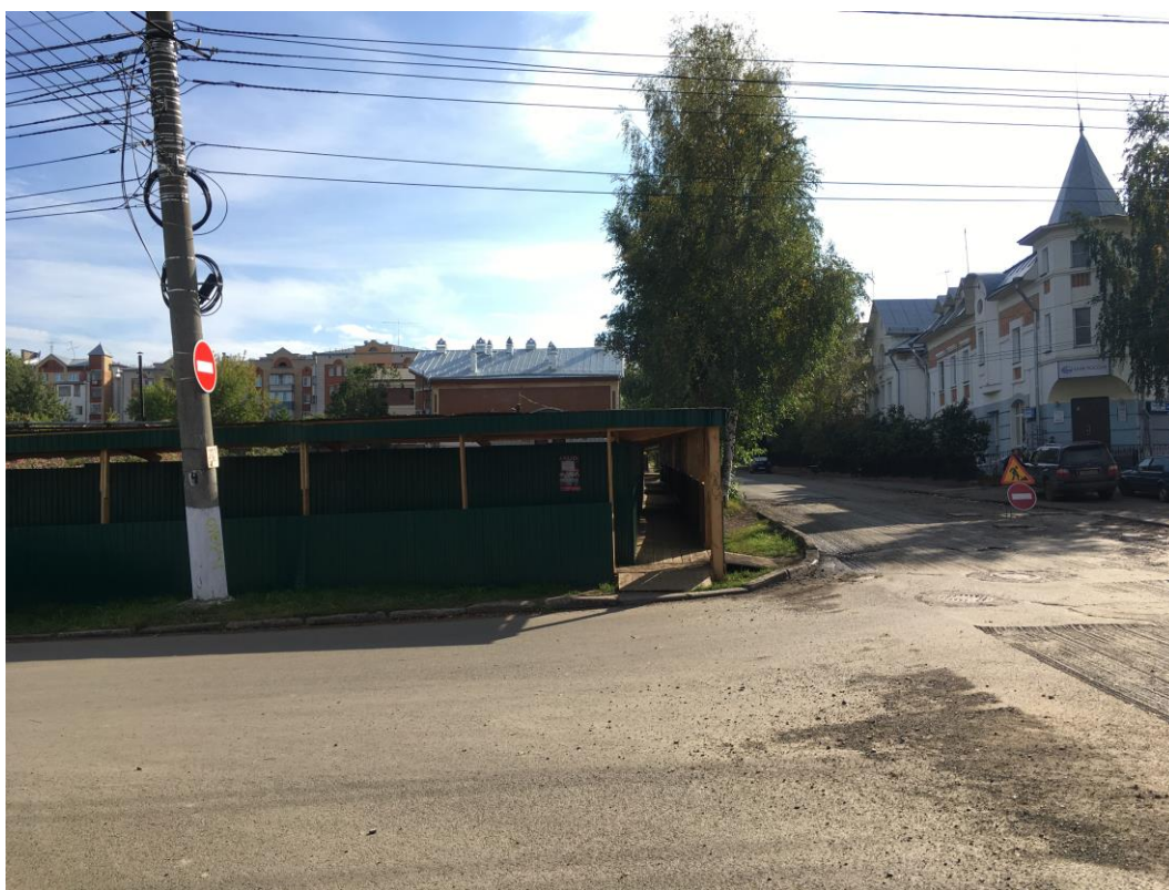
г. Киров, ул. Свободы, 84а. Общий вид на ул. Свободы с перекрестка Свободы и Молодой Гвардии. Слева – исследуемый участок

7. Фотофиксация земельного участка по адресу: г. Киров, ул. Свободы, 84а по состоянию на сентябрь 2017 г.