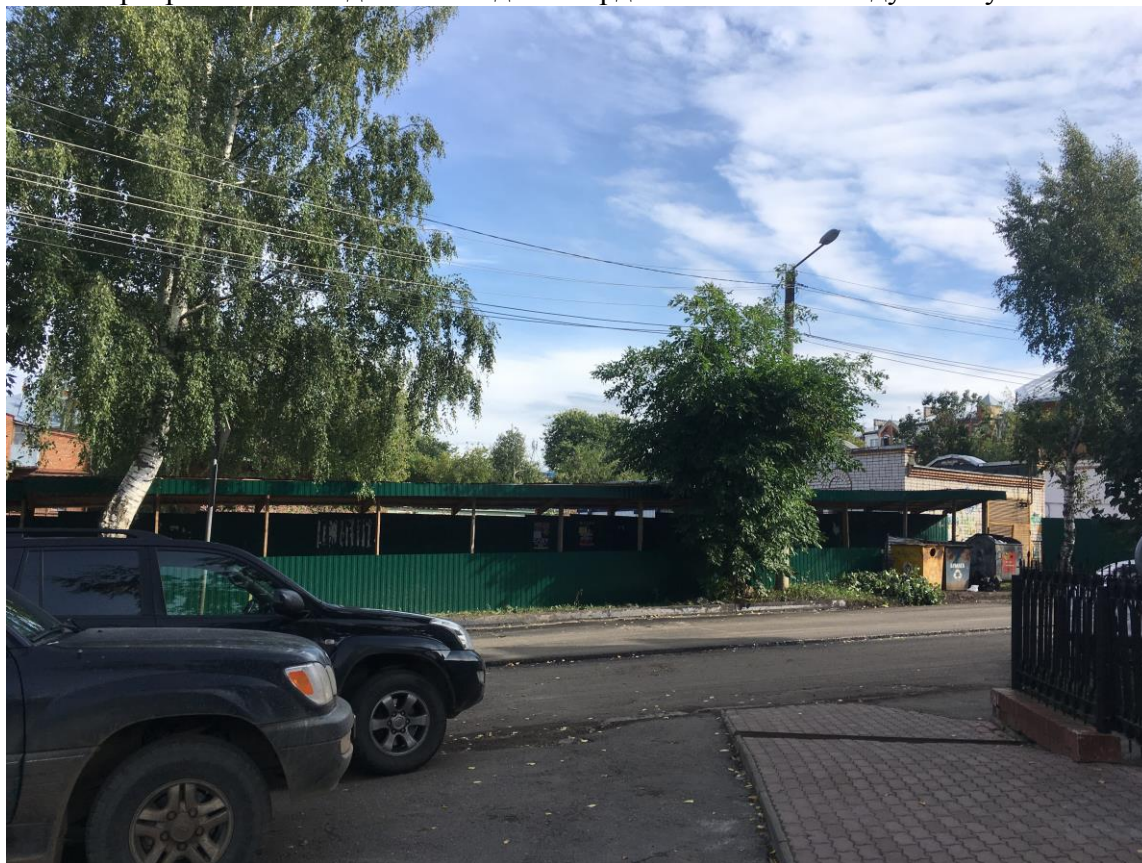
г. Киров, ул. Свободы, 84а. Общий вид на исследуемый участок с нечетной стороны ул. Свободы. Участок расположен за строительным забором.