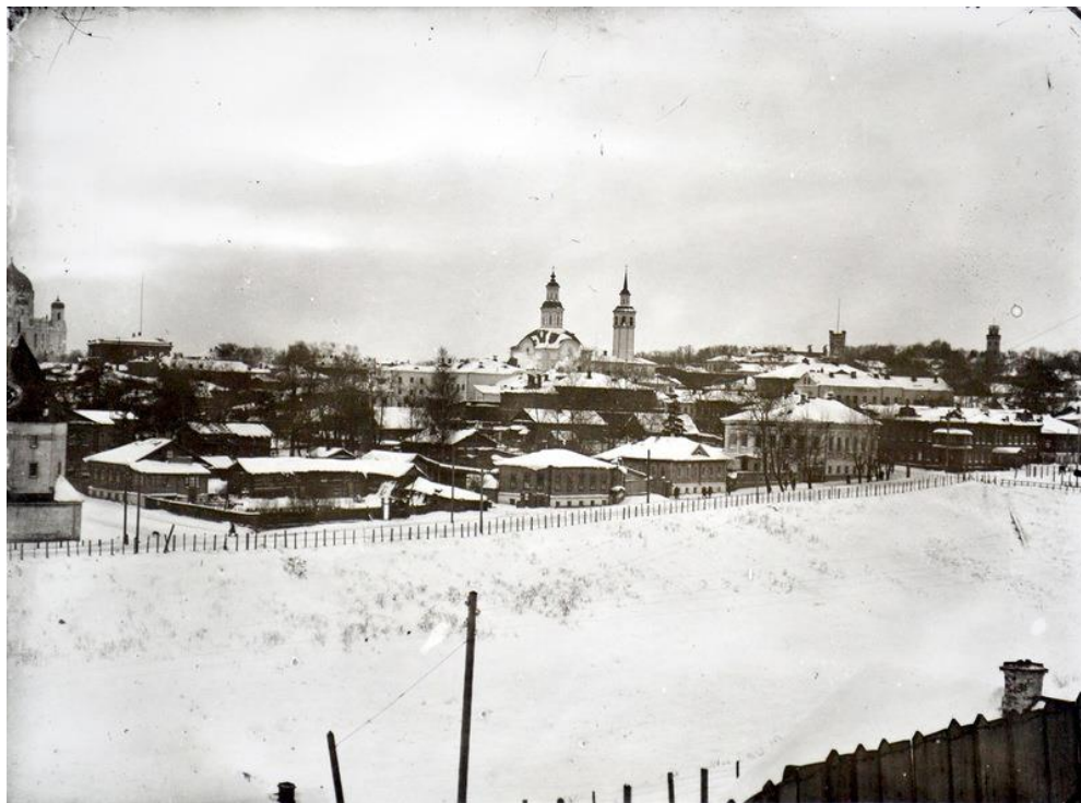
Рис.1. Город Вятка, вид юго-западной части города, оврага Засор, Донской-Стефановской церкви. Архивное фото нач. XX в.

Эта часть города в конце XIX – начале XX вв. была застроена обывательскими домами: деревянными, деревянными на кирпичном цоколе и кирпичными в один и два этажа, под двускатными и вальмовыми крышами. Застройка была усадебного типа, дома главными фасадами выходили на красную линию улиц.