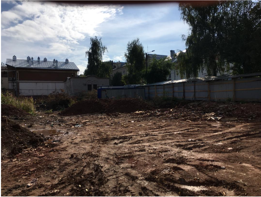
г.Киров, ул.Свободы,84а. Общий вид на исследуемый участок с дворовой территории