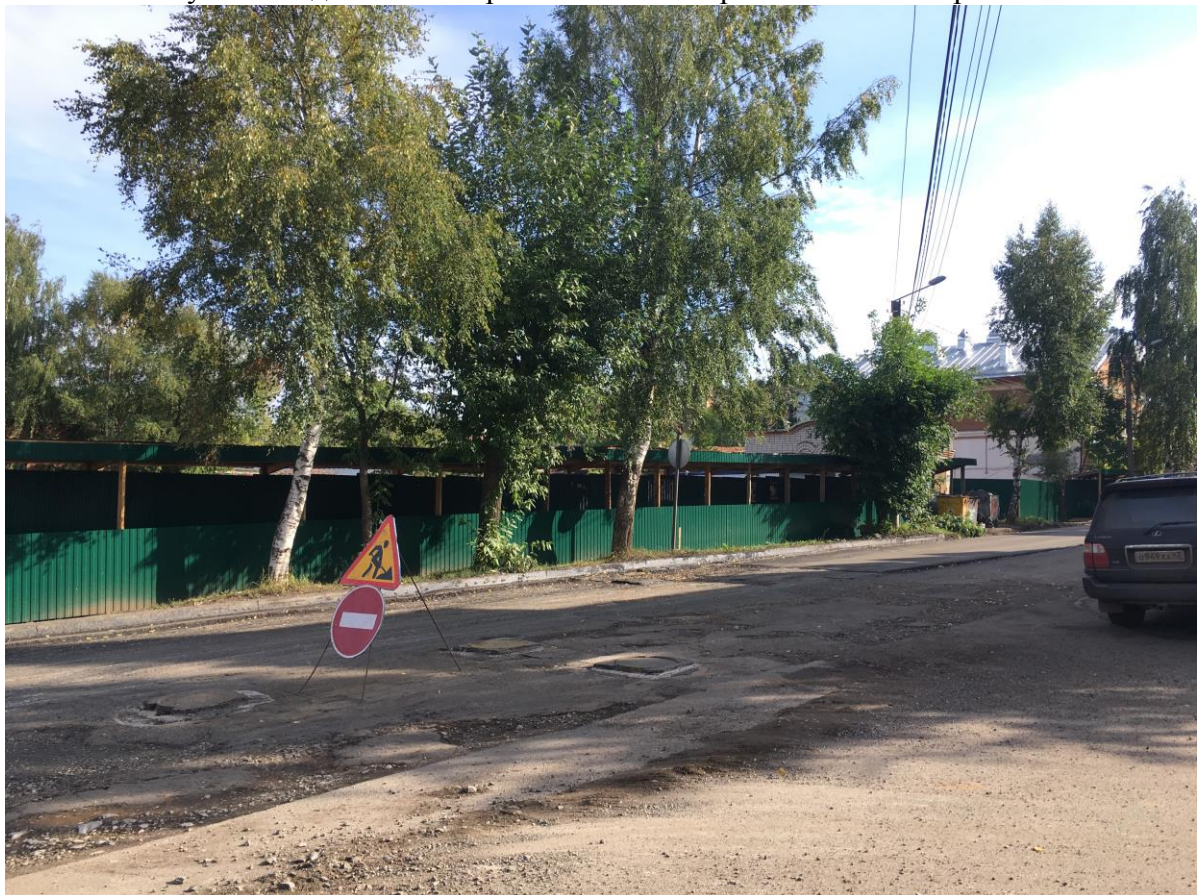
г.Киров, ул.Свободы,84а. Общий вид на исследуемый участок с нечетной стороны ул.Свободы. Участок расположен за строительным забором.