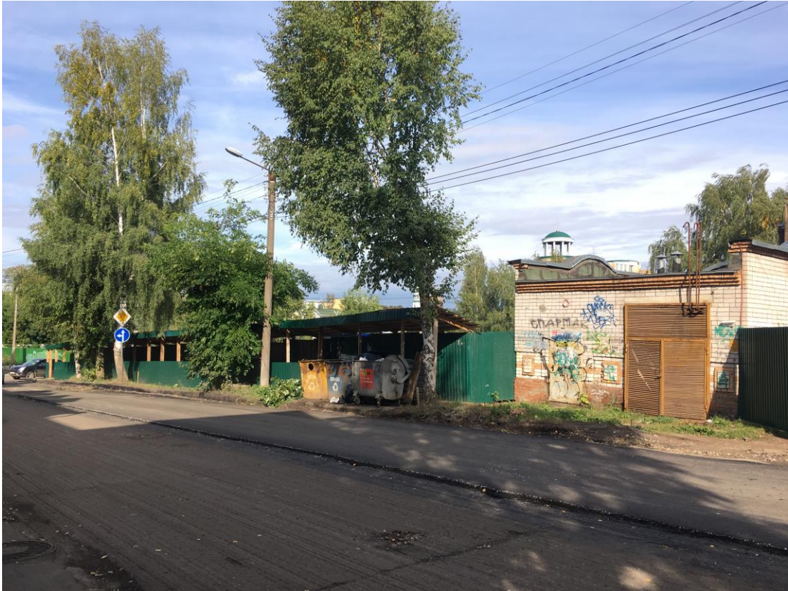
г.Киров, ул.Свободы,84а. Общий вид на исследуемый участок с нечетной стороны ул.Свободы. Участок расположен за строительным забором.