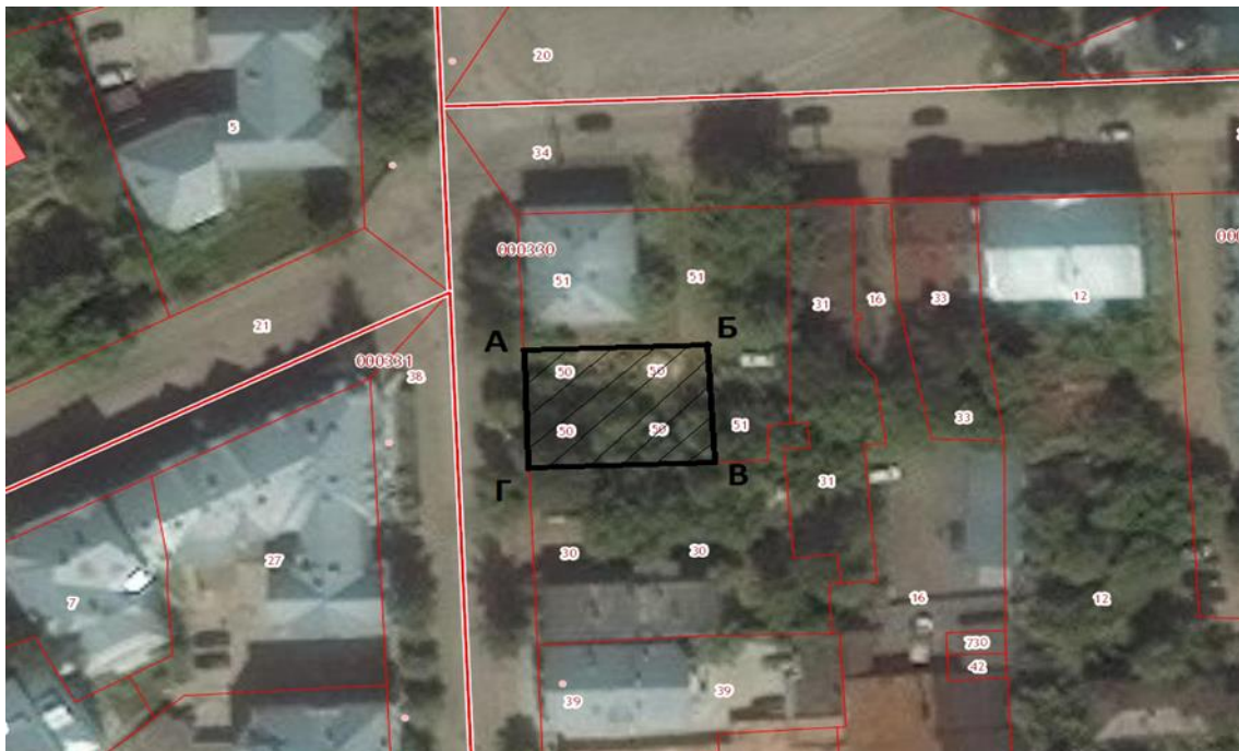
Рис.4. г.Киров. Кадастровая карта. Квартал города, образованный улицами Горбачева, Молодой Гвардии и Свободы. От дома №88 к северу по ул.Свободы расположен рассматриваемый участок с адресом Свободы,84а. На углу улиц Свободы и Молодой Гвардии располагался двухэтажный кирпичный дом, на главных фасадах которого были укреплены адресные таблички – Свободы,84 и Молодой Гвардии,38 (ныне снесен).

В 2010 году «Усадьба Ильина, где в 1889 г. родился художник А.В. Исупов» по адресу: г.Киров, ул.Свободы, 84а была включена в список выявленных объектов культурного наследия на основании Распоряжение департамента культуры Кировской области от 16.11.2010 N 273-а "Об утверждении Списка выявленных объектов культурного наследия (памятников истории и культуры) народов Российской Федерации, расположенных на территории муниципального образования "Город Киров". На официальном сайте Министерства культуры Кировской области ( http://cultura.kirovreg.ru/dokumentyi/obektyi-kulturnogo-naslediya/perechni-obektov-kulturnogo-naslediya-(pamyatnikov-istorii-i-kulturyi) ) в списке выявленных объектов культурного наследия «Усадьба Ильина, где в 1889 г. родился художник А.В. Исупов» по адресу: г.Киров, ул.Свободы, 84а, числится под №63.