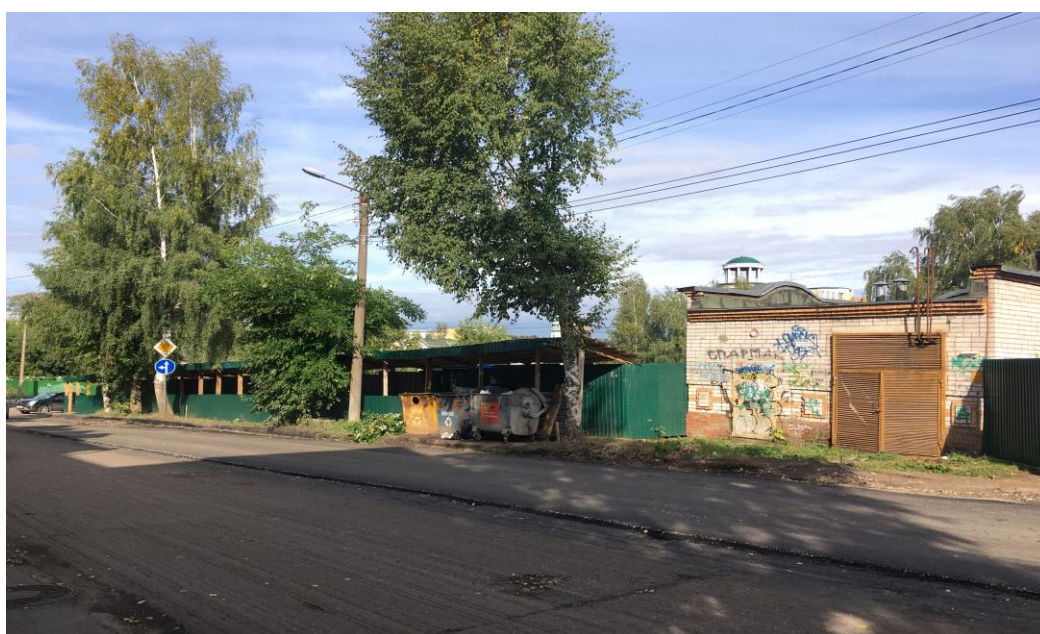
Рис.6. Фотофиксация участка по адресу: г.Киров, ул.Свободы,84а со стороны улицы Свободы. сентябрь, 2017 г.